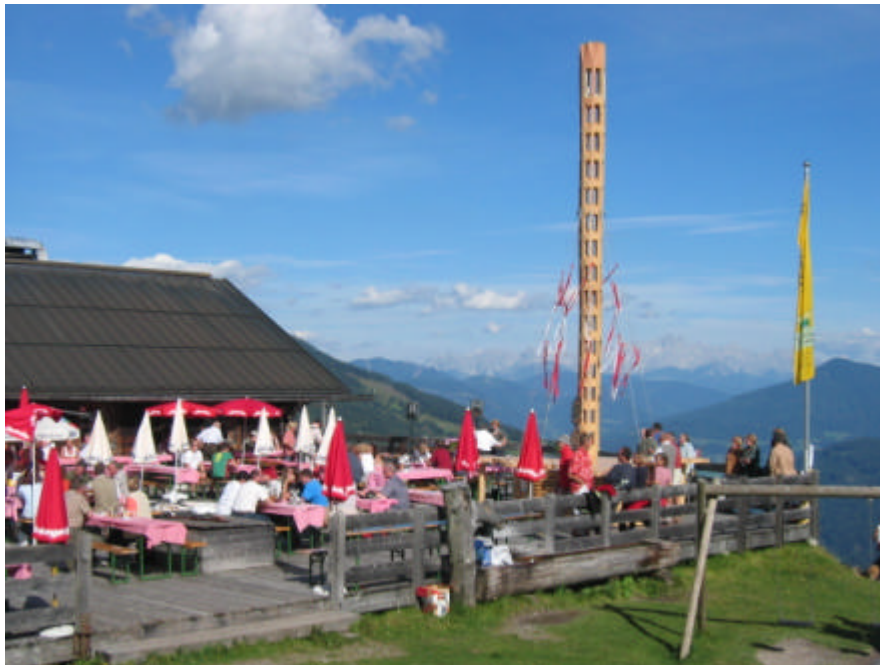
Sonnenterrasse auf der Karbachalm.

Nachdem der Standpunkt ein viel besuchtes Ausflugsziel im Sommer und die erste Schihütte im bekannten Hochkönigs Winterreich darstellt ist ein reger Besuch über das gesamte Jahr gegeben.