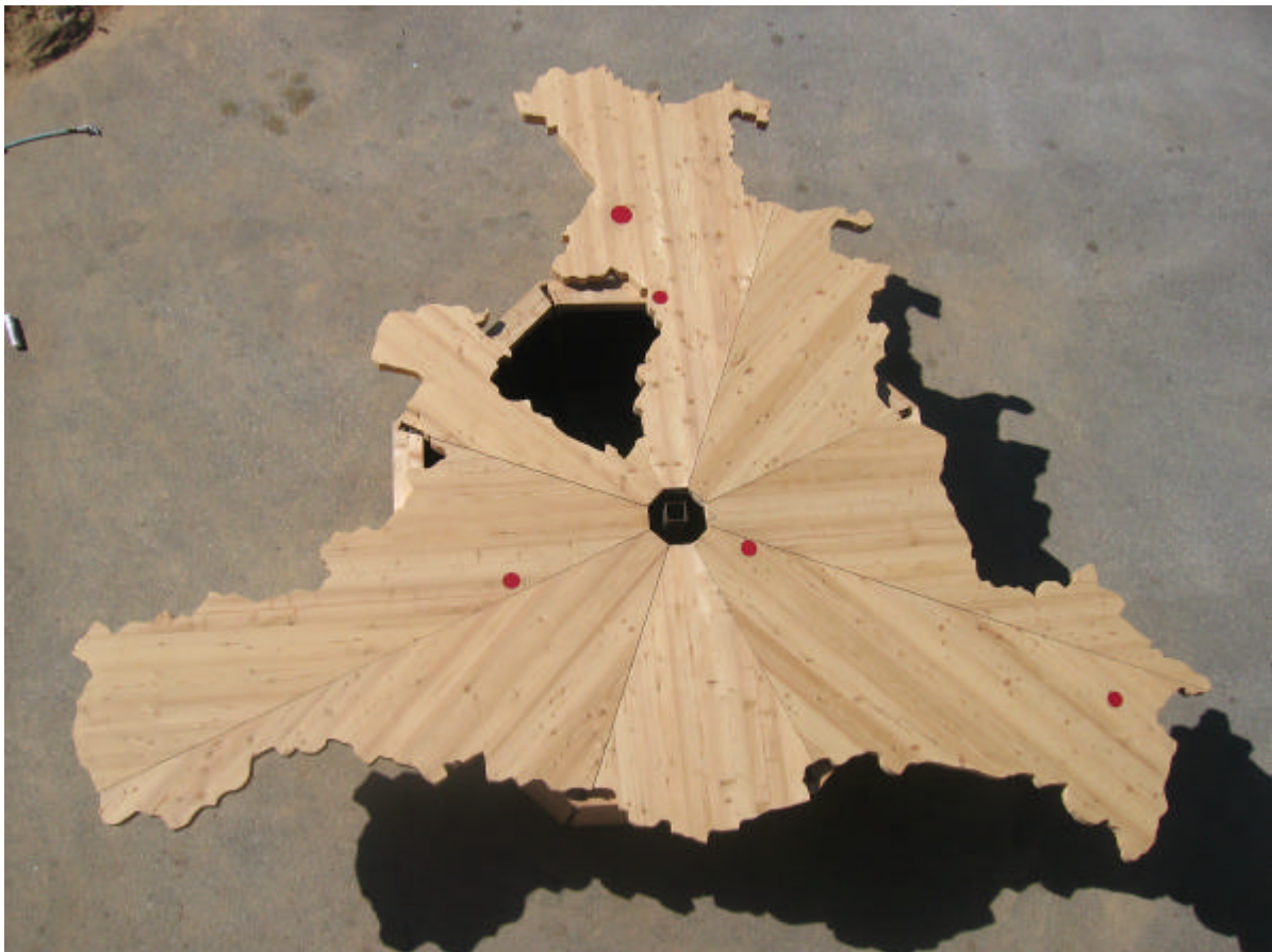
Die Tischplatte ist aus 80 mm starken Massivholz-Elementen angefertigt worden Und hat ein Ausmaß von ca. 550 cm x 450 cm.